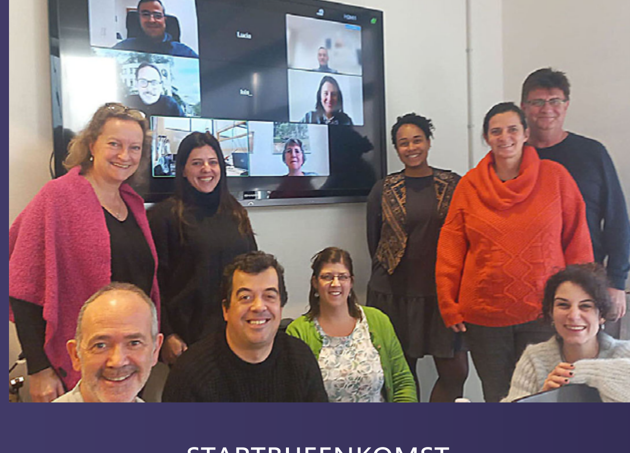
STARTBIJENKOMST, 19-20 JANUARI 2023

De aftrap van DigitalScouts begon met de Kick-off bijeenkomst op 19 en 20 januari 2023, in Gouda, Nederland. De samenwerking werd voortgezet met de tweede transnationale projectbijeenkomst , die online werd gehouden op 23 en 24 oktober 2023.