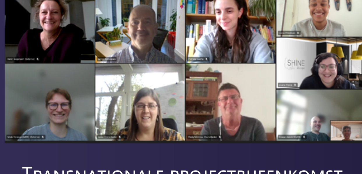
TRANSNATIONALE PROJECTBIJENKOMST, 23-24 OKTOBER 2023