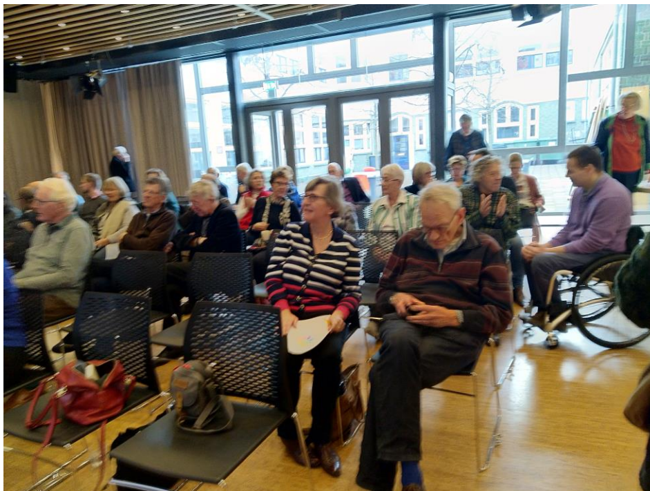
de deelnemers luisteren aandachtig

Conclusie: er is een grote vraag naar betaalbare en toegankelijke woningen op wijk- en buurtniveau.